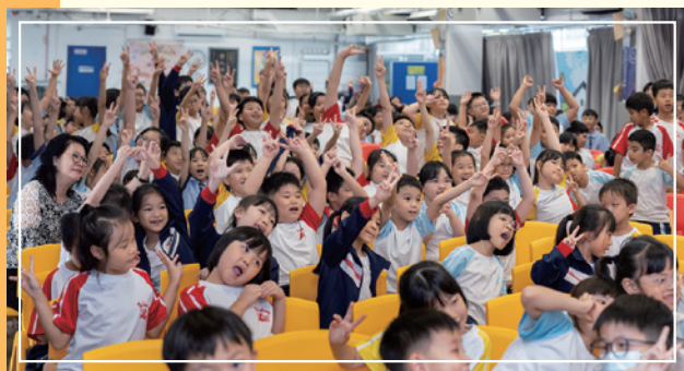
讓每一位學生在愛中成長，活出豐盛生命。

箴言二十二章6節提醒我們：「 教養孩童走當行的道，就是到老他也不偏離。 」這是我們教育事工的核心信念。未來，我們將在信仰的根基上，與時並進，提升區會辦學水平，強化品牌，推廣基督教教育的使命，讓每一位學生在愛中成長，活出豐盛生命。願我們攜手同行，並肩培育，見證基督大愛，為香港教育寫下新的篇章。