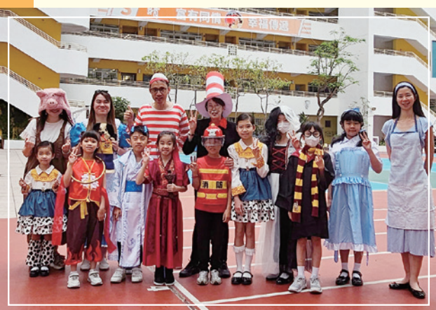
培養正向團隊文化。