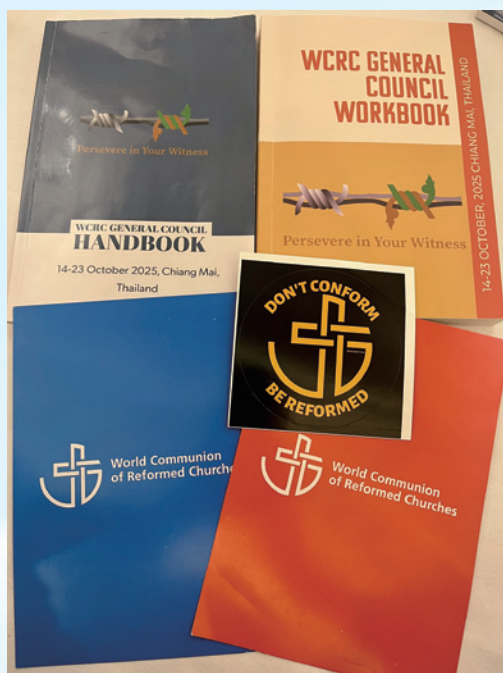
本屆大會手冊、會議資料以及共識卡。