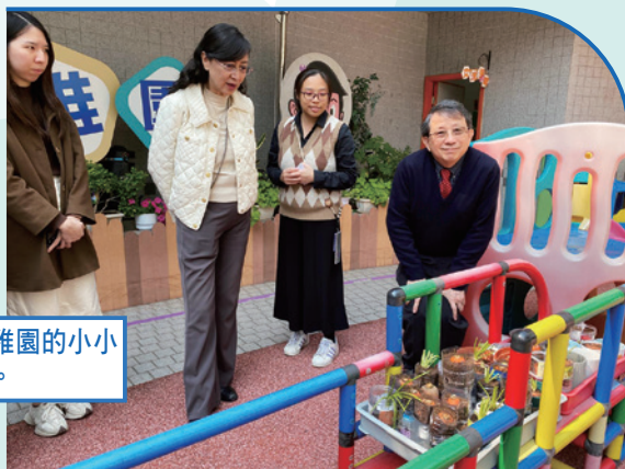
參觀幼稚園的小小種植區。