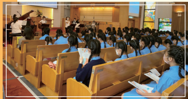
培育學生認識真理。