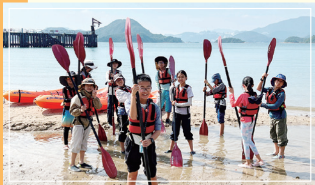
學生參加Outward Bound等歷奇及團體活動。

面對不確定的時代，我們可以參考Mulford 教授（2010）對學校改進的研究心得：