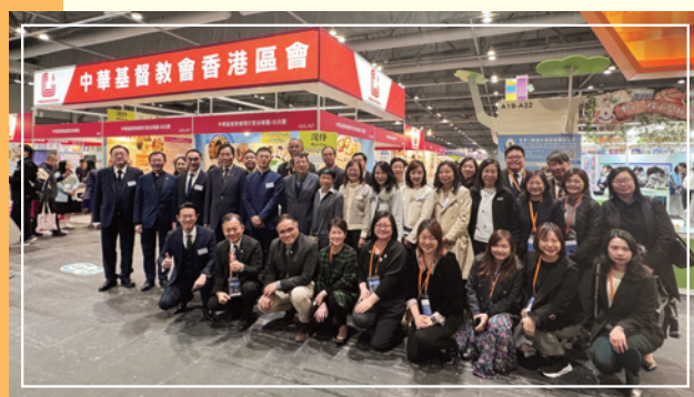
區會參加大灣區教育展，推廣區會形象。