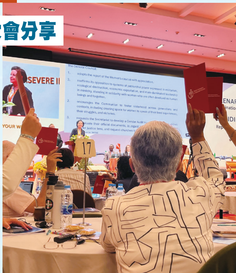
在決策會議上舉起共識卡以表達意見。