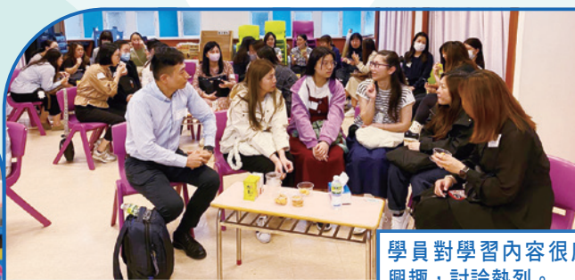
學員對學習內容很感興趣，討論熱烈。