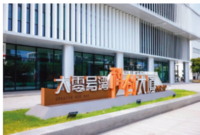
大零號灣是上海市內科創灣區。

我們抵達上海後，先到大零號灣參觀，它是上海市閔行區的科技企業園區。園區內以醫療機械人、人工智能、海洋裝備及新材料領域，四大產業企業為主。透過參觀及講解，讓大家看到國家如何構建創新科技一體化，藉著人才鏈、創新鏈及產業鏈貫通高技術企業集群，全面建造創新能力、科技力量、原創成果，成功發展科技創新策源高地，成為世界級「科創灣區」之一。