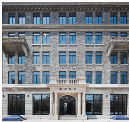
昔日中華全國基督教協進會於上海的會址。

教協進會是中華民國時期中國基督教部分宗派教會和跨宗派性基督教團體共同設立的協作機構，包括16個公會及6個教會團體。