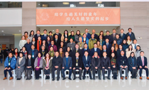
完成締結簽約儀式後大合照。

在簽約儀式後，各位教育界同工連同蘇州各校的대표隨即在蘇州市實驗小學的校內場館觀摩「一帶一路」倡議十周年蘇州教育回顧展演，我們一同欣賞蘇州的教育成果表演。節目完結後，香港的校監、校董及校長們分成十五隊，由姊妹學校的校長帶領前往其學校進行參觀交流。