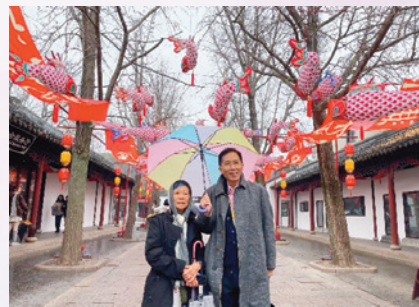
我們在虎丘留下不少倩影。

匆匆五天的行程隨著探訪虎丘之後便完結。我們吃過午飯之後便乘車往機場去。今次的行程雖短，但收穫豐碩，除了認識不少國內學校的文化特色，開闊眼界外，也藉此機會讓我們深入了解內地教會，我們兄弟姐妹也有團契交流，這些都是難忘珍貴的美好回憶。