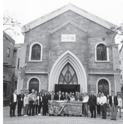
小學校長會到佛山交流時到訪升平堂