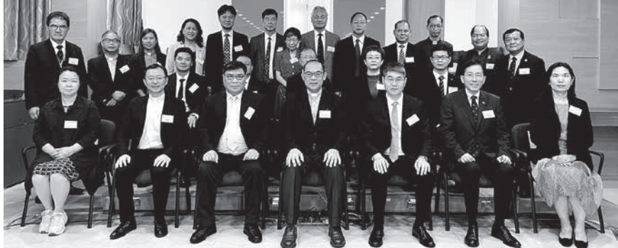
廣東省基督教兩會代表團到訪本會的合照

隨著本港與各地均解除出入境檢疫安排，到今年二月香港與內地更全面通關，停頓了約三年的接待來訪嘉賓或出訪活動又再次熱鬧起來。