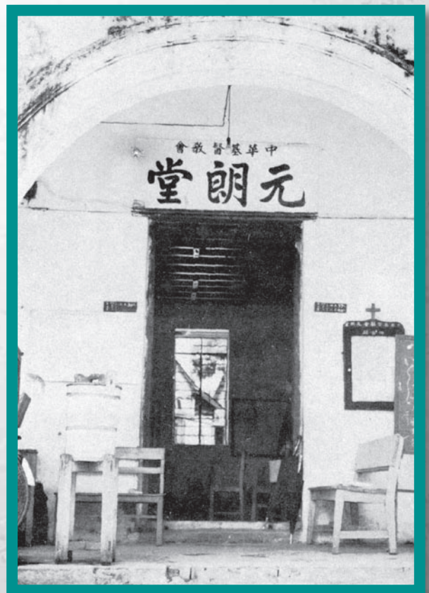
新界佈道事工的起點：元朗堂東門口舊址。