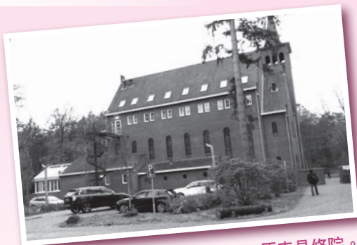
會議的地方，也是酒店一部分，原來是修院。

每天早上，我們都有查經的時間。我最深印象的是一位荷蘭基督教神學大學（Protestant Theological University）教授帶我們查考的拿鴻書和約拿書。兩卷書均針對當時中東一帶最強大的亞述帝國，先知拿鴻所講上主審判亞述的信息無疑為帝國的受害者帶來力量，但是，約拿所傳遞上主憐憫和赦免的信息同樣鼓舞人心。今天，誰是帝國呢？我們會選擇那個信息向帝國說呢？我們又有沒有在合適的時間，合適的處境，向合適的對象說合適的話呢？先知在二千年以前的話，