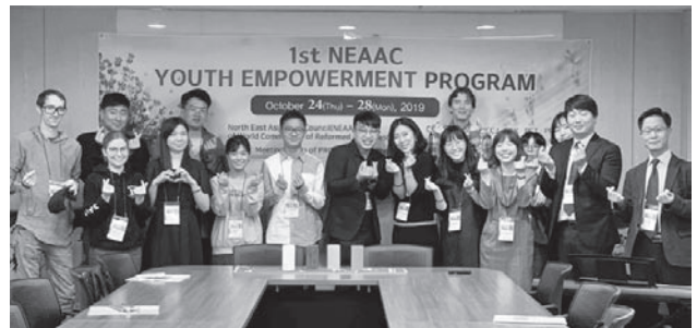
前排左五為本文作者

回望香港，教會與青年的同行足夠嗎？不同群體之間有對話的橋樑嗎？能夠為不義發聲嗎？在這紛亂的世代中，香港的堂會之間，甚至東北亞區，乃至全球的教會之間，可以如何連結合一、凝聚力量，為天國臨到地上的藍圖作出更大的貢獻？我們還有很長的路。但最重要的是越來越多有合一抱負和願景的年青人可以彼此共同努力，正如我們計劃中最後的共同禱文：「讓我們為那些沒有聲音和少數群體發聲，讓我們敞開心胸地交談，讓我們設法克服困難，分享我們的願景，並與當地教會互相代禱，共創美好的未來。」