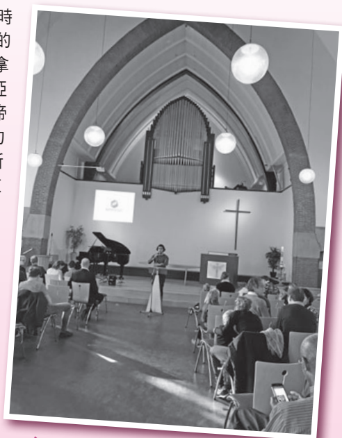
主日在鹿特丹到訪和參與崇拜的教會。