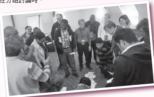
大家一起砌出有字眼的砌圖。